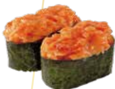
G1.SPICY SAKE Salmone, maionese tabiko, salsa piccante e maionese piccante allergeni: (🌾) (🐠) (🥚) €4.00