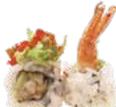
U22. GREEN ROLL

Gambero fritto maionese, insalata teriyaki, tobiko