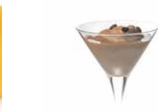
Sorbetto Al Caffè