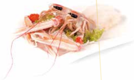
● S5.SCAMPI Scampi-3pz allergeni: (S) (A) €6.00 max 3 porz