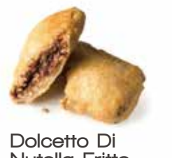
Dolcetto Di Nutella Fritto