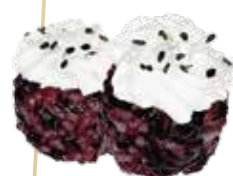
G12.GUNKAN BLACK PHILA philadelphia, sesamo e teriyaki allergeni: (🌿) (🥚) (🌾) €5.00