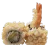
U21. SOFY ROLL