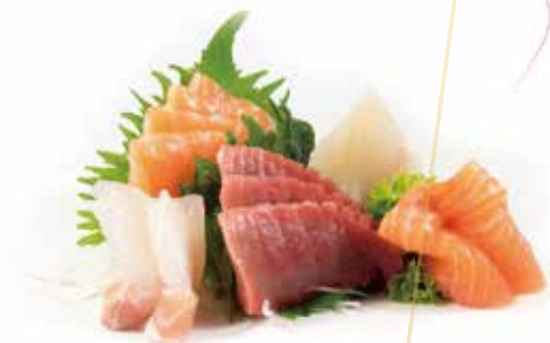
S6.SASHIMI MISTO Salmone, tonno e branzino allergeni: (S) (A) €10.00