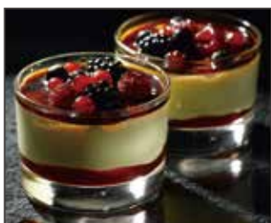
Coppa Creme Brulee E Frutti Di Bosco

crema al gusto di vaniglia con salsa di lamponi frutti e di bosco ricoperti di caramello