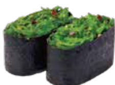
G9.GOMA WAKAME Alge agro piccante allergeni: (🌾) (🥚) €4.00