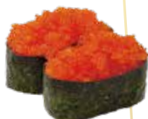
G6.GUNKAN TOBIKO Uova di pesce Volante allergeni: (🌾) €5.00