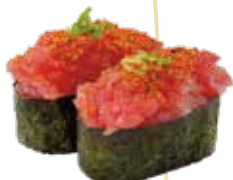
G2.SPICY TUNA Tonno, maionese tabiko, salsa piccante e maionese piccante allergeni: (🌾) (🐠) (🥚) €4.50