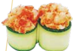
G5.GUNKAN EBI Gamberi cotti maionese, avocado tobiko e zucchina allergeni: (🌾) (🥚) €5.00