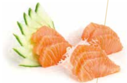
S1.SAKE Salmone-5pz allergeni: (S) (A) €7.00