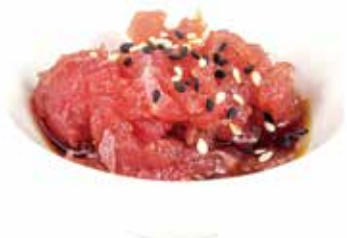
TA2.TONNO Tonno, sesamo e salsa ponzu allergeni: (S) (A) (S) (A) €9.00