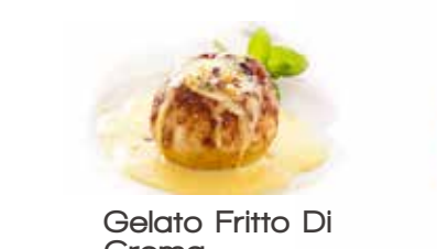
Gelato Fritto Di Crema