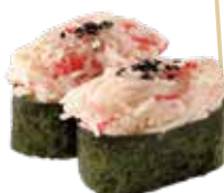
G10.GUNKAN KANI Surimi trittato con maionese, salsa rosa allergeni: (🌾) (🥚) (🌿) €4.50