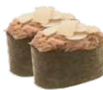
G11.GUNKAN MIURA Salmone cotto, mandorle e teriyaki allergeni: (🐠) (🌿) (🥚) €5.00