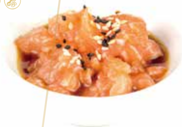
TA1.SALMONE Salmone, sesamo e salsa ponzu allergeni: (S) (A) (S) (A) €8.00