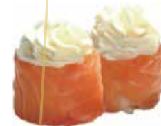
G8.FLOWER LOVER Salmone e philadelphia allergeni: (🌾) (🥚) €5.00