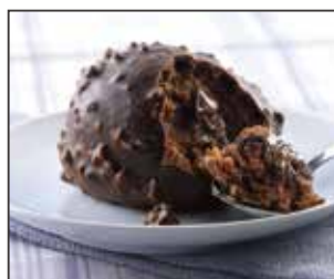
Cupolina Al Cioccolato Croccante

pan di Spagna al cacao farcito con crema alla nocciola e ricoperto con cioccolato al latte e nocciole