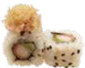
U26. CRISPY KANI ROLL

Surimi fritto, avocado salsa rosa, kataifi