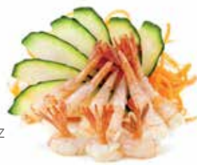
● S4.AMAEBI Gamberi crudi-3pz allergeni: (S) (A) €11.00 max 3 porz