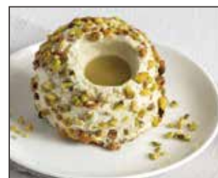
Tartufo Al Pistacchio

Gelato semifreddo al pistacchio con cuore al pistacchio, decorato con nocciole pralinate e granella di pistacchio