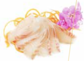
S3.SUZUKI Branzin-5pz allergeni: (S) (A) €8.00