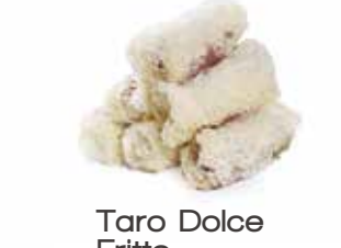
Taro Dolce Fritto