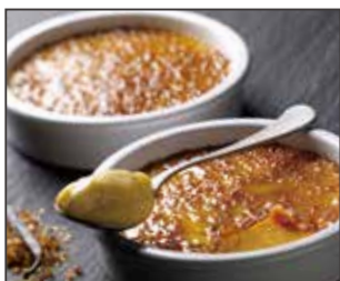
Crema Catalana In Coccia