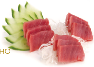
S2.MAGURO Tonno-5pz allergeni: (S) (A) €8.00