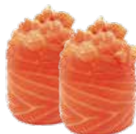
G3.GUNKAN SALMONE Salmone, maionese e tobiko allergeni: (🌾) (🐠) €4.00