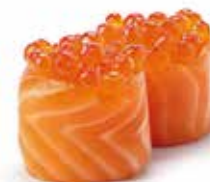
G7.GUNKAN IKURA Uova di salmone allergeni: (🌾) (🐠) €5.00 max 1 porz